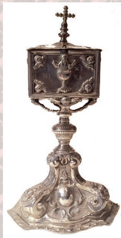
Fig. 1 - Argentiere palermitano, 1717-1718, Pisside, vista frontale con Torchio mistico, Mezzojuso, S. Maria di tutte le Grazie.

L'incontro di diverse culture nella comunità mezzojusara, così come nelle altre località dell'Eparchia di Piana degli Albanesi, ha fatto sì che avessero influenze anche sulle suppellettili d'argenteria sacra, presentando diversi tipi