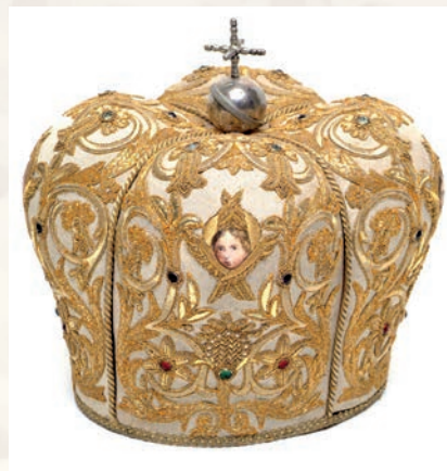
Fig. 2 - Manifattura romana, fine del XIX sec., Mitria, Mezzojuso, San Nicolò di Mira.

all'interno della custodia in cui c'è scritto: «G. Romanini/ Parati sacri e ricami/ Via Torre Millina 26 Roma», ed è cronologicamente da assegnare agli anni del vescovato del suddetto presule 12 .