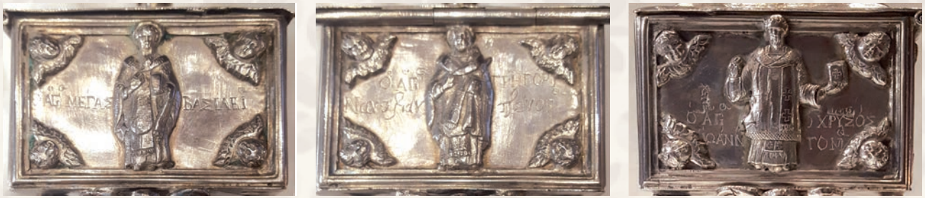
Fig. 1 a-b-c - Argentiere palermitano, 1717-1718, Pisside, viste laterali con Santi Basilio il Grande, Gregorio Nazianzeno e Giovanni Crisostomo, Mezzojuso, S. Maria di tutte le Grazie.